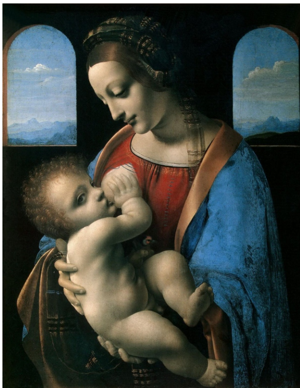
Леонардо да Винчи, «Мадонна Литта» (1490—1491)

Самые лучшие инвестиции - вложение молока в ребенка Уинстон Черчилль